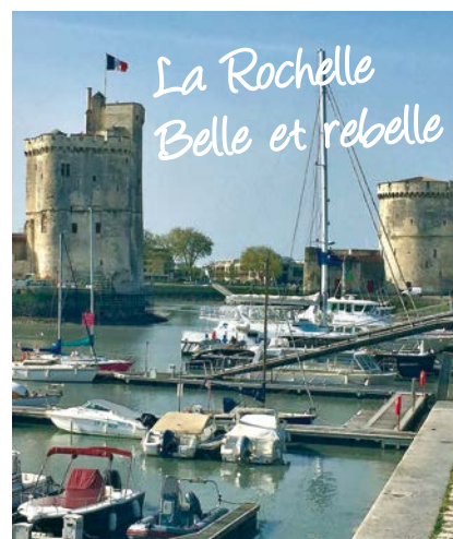
Vieux port de la Rochelle.

Mais outre le fait de proposer un congrès pour l'histoire, nous voulons également vous faire découvrir ou redécouvrir la ville de La Rochelle avec de nombreuses richesses patrimoniales, une histoire et une