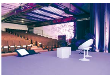
Le Forum des Pertuis.

L a section de Charente-Maritime de l'AMOPA vous prépare un accueil des plus chaleureux pour le congrès international des 16 et 17 mai 2020.