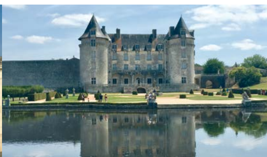
Le château de la Roche-Courbon.