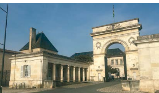
L'Arsenal de Rochefort La Corderie royale, L'Hermione. CLICHÉ AMOPA 17